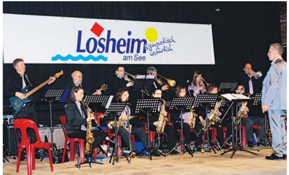
Die Big Band „MuSe“ umrahmte das „Dankeschönfest“ der Gemeinde mit beschwingten Melodien.

Er bedankte sich dafür, dass so viele ehrenamtlich engagierte Bürgerinnen und Bürger der Einladung gefolgt seien, um zu feiern und über Gegenwart und Zukunft der Gemeinde Losheim am See zu reden. Zukunft könne man bauen, so der Bürgermeister, das bedeute, in der Gegenwart aktiv zu werden und Strategien und Pläne für die Zukunft zu machen. Dabei könne man auf das ehrenamtliche Engagement der Vereine als wichtiges Fundament des Gemeinschaftslebens aufbauen. Daher auch der Name „Dankeschönfest“, der die unermüdete Arbeit der vielen ehrenamtlich Tätigen in der Gemeinde würdigen solle. „Die Gemeinde Losheim am See ist eine attraktive Kommune mit einem starken Dienstleistungs- und Handelangebot und einer wunderschönen Landschaft“, bemerkte der Verwaltungschef nicht ohne Stolz. Mit über 1 Million Gästen gelte sie innerhalb des Saarlandes auch als eine der stärksten Tourismusgemeinden. Diese Attraktivität wolle man weiterhin steigern und auch den Status als kinder- und familienfreundliche Kommune erhalten und ausbauen, fixierte Lothar Christ das angestrebte Zukunftsbild. Aber auch die Probleme der Gemeinde, wie den Erhalt des Krankenhauses oder die Schließung und Verlagerung von Elatech nach Büschfeld und den drohenden Abbau bzw. Verlust von Arbeitsplätzen, für deren Erhalt sich die Gemeinde entsprechend einsetzen werde, ließ der Bürgermeister nicht außen vor, „Es gibt bei aller