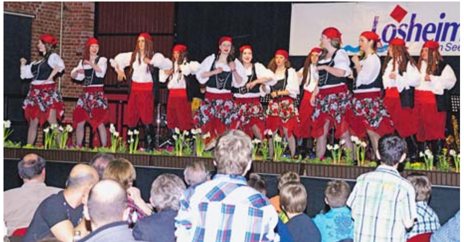
... und die Tanzgruppe „Beat Freaks“ aus Mitlosheim erhielten für ihre gekonnten tänzerischen Darbietungen viel Applaus.