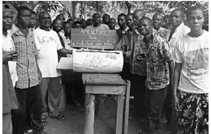
Nachhaltige und waldverträgliche Familienbienenstockimkerei statt Honigbaumfällen und Zerstörung der Völker

Die Diözesankommission Bokungu-Ikela hat uns zwei neue Projektprogramme geschickt. Gemeinsam mit ihren Partnern BDD (Diözesanes Entwicklungsbüro) und FFPa, einer regionalen Bauernorganisation, möchten Sie etwas gegen die Abholzung der Honigbäume und für den Unterhalt der Familien tun. Angeregt von unserem Bienenstockprojekt im Bas-Congo lancieren sie eine Sensibilisierungskampagne und ein Kreditprogramm für die Erstellung von nachhaltigen Familien-Bienenstöcken mit lokalen Mitteln – damit die Raubernte mit Baumfällen und Zerstörung der Bienenstöcke aufhört. Das Programm „Elefantenfuß-Schulbänke“ möchte die Ausstattung der 300 Vor-, Grund- und Sekundarschulen mit einfachen lokal hergestellten Schulbänken fördern – angeregt vom Schulbankprojekt der Partnerschaftskomitees Losheim am See/Bokungu RDC. Bisher sitzen die Schüler auf dem Boden, oft genug im Sand – schwierig und wenig förderlich