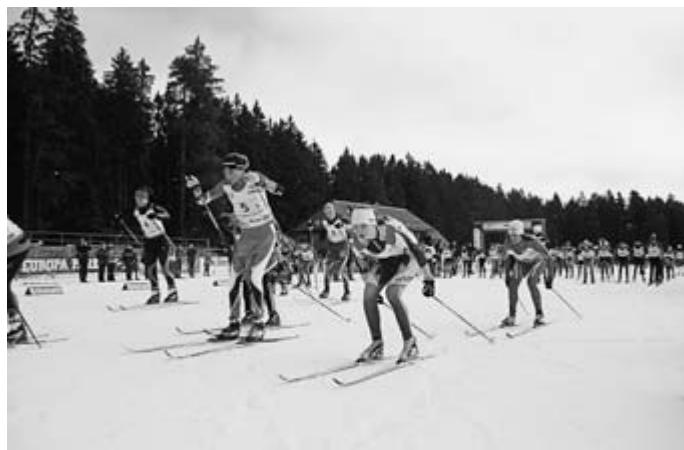
Start beim Bundesfinale „Jugend trainiert für Olympia“ im Skilanglauf in Schonach