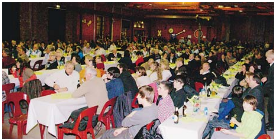
In geselliger Runde kam es zu vielen fruchtbaren Gesprächen unter den Vereinsvertretern.

In seinem Schlusswort wünschte Bürgermeister Christ den Gästen gute Unterhaltung und lud zum anschließenden Buffet ein.