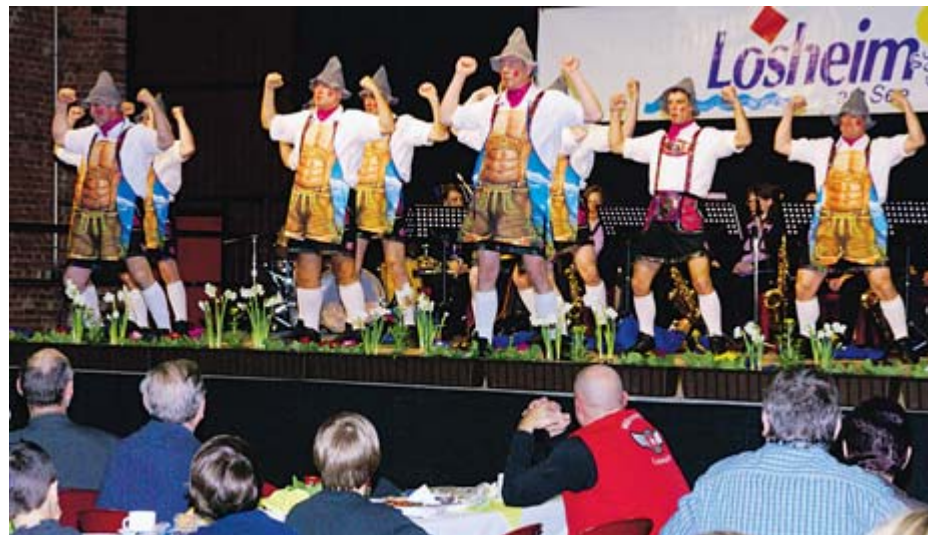
Das Männerballett der KG „Rot-Weiß“ Losheim ...

Schönheit und Gutem in unserer Gemeinde viel zu tun, dafür brauchen wir eine feste Gemeinschaft und Bürgerengagement mit Übernahme von Verantwortung“, stellte der Bürgermeister überleitend fest und schloss damit den Kreis zur Intention und zum Anlass der heutigen Veranstaltung. Hierbei falle den Aktiven in der Gemeinschaft ebenfalls eine tragende Rolle als Multiplikator und Meinungsträger zu. Auch beschränke sich die freiwillige und ehrenamtliche Tätigkeit nicht allein auf soziale Aufgaben, son-