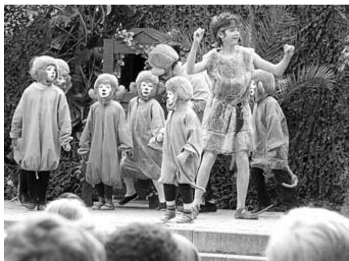
...des Kupferbergwerks in Düppenweiler restlos begeistert.