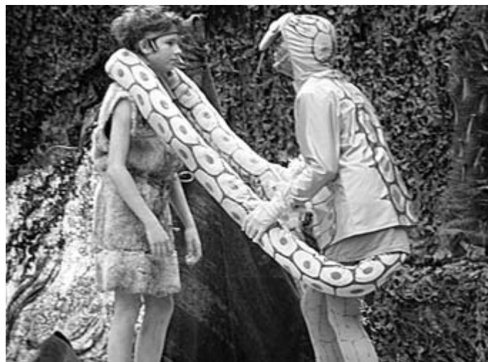
Die Schüler waren von der Aufführung des Dschungelbuchs auf der Freilichtbühne...

Grundschule Losheim besuchte „Dschungelbuch“ in Düppenweiler: Kurz vor den Sommerferien gab es wieder ein Highlight für die Schüler der Nicolaus-Voltz-Grundschule in Losheim.