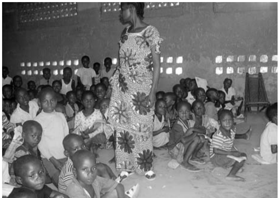
Einige Schüler bringen sich „Untersetzer“ mit: Steine, Baumstücke; die Lehrerin einen lokalen Stuhl aus Stecken und Lianen.

sowie die Begleitung von Projekt und Schule. Die einfachen Bänke werden von lokalen Handwerkern ganz in Handarbeit hergestellt, ebenso die Türen und das