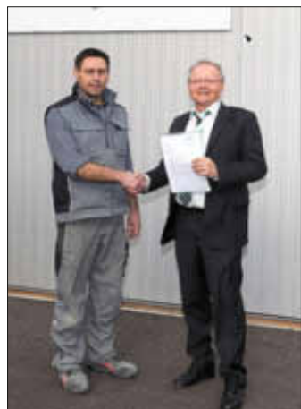
Übergabe des Startgelds