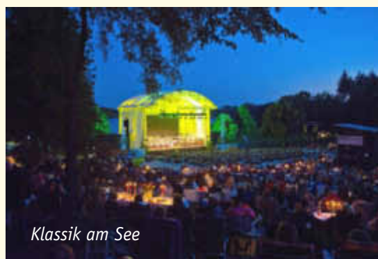
Klassik am See

Zum Abschluss gibt es wie immer ein fulminantes Höhenfeuerwerk. Konzertbeginn 20.00 Uhr, Einlass ab 18.00 Uhr. Im Eintritt ist auch der Besuch des Park der Vierjahreszeiten ab 18 Uhr enthalten. Preise: Liegewiese 45 EUR, Bestuhlt Kategorie 1: 65 EUR, Kategorie 2: 55,50 EUR, Karten im Vorverkauf und Ticketservice bei der Tourist-Info am Stausee Losheim, Tel. 06872/9018100 sowie bei allen Vorverkaufsstellen von www.ticketregional.de