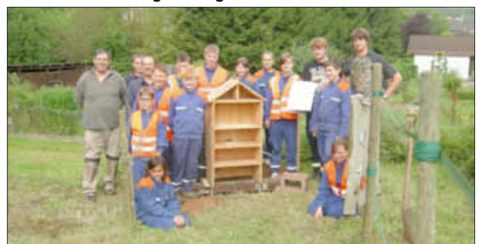
Jugendfeuerwehr mit älteren Jugendlichen nach gelungenem Einsatz

Am vergangenen Freitag/Samstag führte unsere Jugendfeuerwehr einen sogenannten Berufsfeuerwehrtag durch. In diesem Rahmen wurden einige Übungen absolviert. Hierbei wurden sie von einigen Mitgliedern der Aktivwehr unterstützt. Es wurden zum Teil sehr anspruchsvolle feuerwehrtechnische Fertigkeiten gefordert. Auch wurde im Rahmen einer technischen Hilfe ein Insektenhotel beim Garten des Obst- und Gartenbauvereins montiert. Daneben wurden noch viele Einsätze in realistischen Situationen durchgeführt. Ich spreche hier meine Anerkennung für die Jugendlichen und deren Ausbilder aus, die eine solche Aktion wie den Berufsfeuerwehrtag durchführen. Hier wird eine Ausbildung geleistet, die dem Zweck dient später im Ernstfall Hilfe leisten zu können. Da dies längst nicht selbstverständlich ist und der Allgemeinheit dient, erwähne ich es bei diesem gegebenen Anlass.