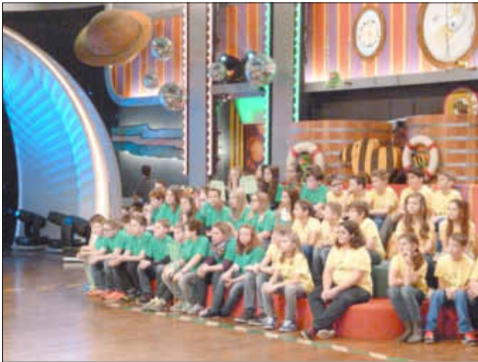
Losheimer und Weiskircher Schüler bei der Sendungsaufzeichnung

ler knapp vor den Weiskirchenern behaupten konnten. Somit ging die Silbermedaille samt 400 Euro an die Eichenlaubschule, die ihr Geld an den Verein „Angelman e.V. Konstanz“ spenden möchte. Gold samt 600 Euro erhielten die Schüler aus Losheim für den Merziger Verein „Flinke Flöhe“.