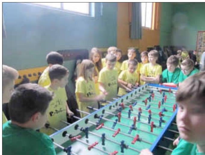
Losheimer und Weiskircher Schüler beim gemeinsamen Tischfußballspiel