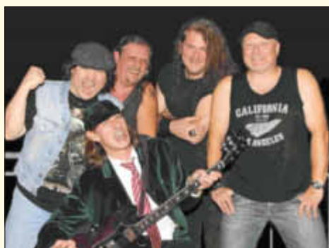
Legends of Rock - AC/DX

Am 18. und 19. Juli findet im Eventgelände am See das größte Rock-Tribute-Festival des Landes in diesem Jahr mit folgenden Bands statt: