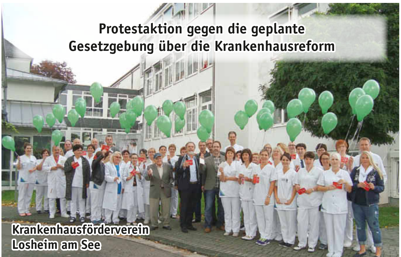
Krankenhausförderverein Losheim am See

04.10.2015 DAS NATURBURSCHENFEST IM CARL DEWES PARK, LOSHEIM AM SEE