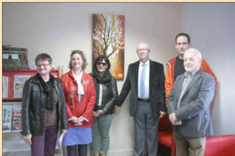
Enthüllung des Gemäldes in der neuen Mediathek

Er freute sich das 17jährige Bestehen der Partnerschaft feiern zu können und war zuversichtlich, dass auch bei diesem Treffen neue Freundschaften entstehen und bestehende vertieft würden. Getragen werde diese Partnerschaft auch von engagierten Bürgerinnen und Bürgern auf beiden Seiten und gestalte sich dadurch besonders abwechslungsreich.