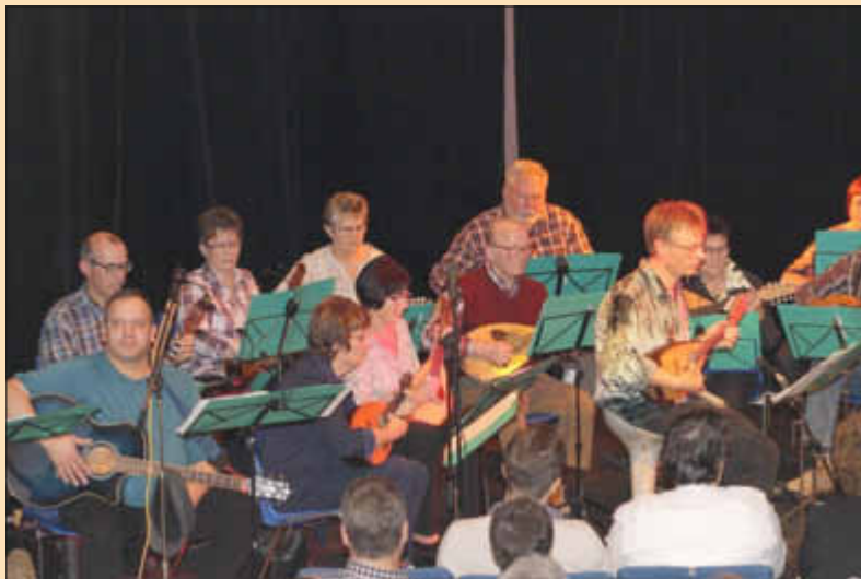
Auftritt des Zupforchesters Bachem

In La Croix Saint Ouen angekommen wurde man von der örtlichen Partnergemeinde und dem Comité de Jumelage sowie Gastfamilien herzlich empfangen und bewirtet.