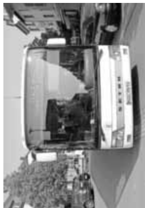
Neuer Fahrplan gültig ab 28.09.2015