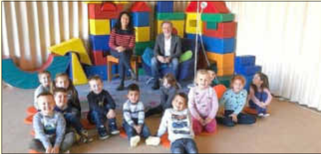
Lesestunde mit Bürgermeister Lothar Christ in der Kita Villa Regenbogen in Losheim ...